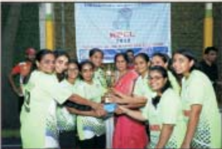
GIRLS WINNER TEAM KARAGHOGHA SMASHERS