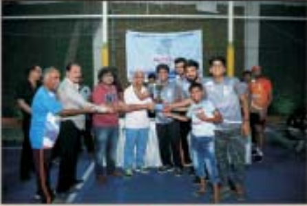
BOYS PLATE CUP WINNER GHOGHA RAISING STARS