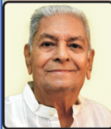
સ્વર્ગારોહણ : તા. ૯.૬.૨૦૧૯

જેમના વાત્સલ્યતાનું અવિરત અમૃતપાન કરતાં રહ્યા અને સંસ્કારી જીવન ઘડતર પામ્યા એવા વાત્સલ્યહૃદયી પૂજ્ય વડીલશ્રીની ગુમાવી છે શીતળ છાયા. એમની યાદ અવિરત આવશે અને વિયોગ થકી આંખો ભીંજાશે. દિવંગતશ્રીના પુનિત આત્મા પ્રતિ આદર વંદના.