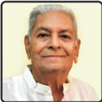
અરિહંત શરણ : તા. ૯.૬.૨૦૧૯

પરિવારમાં પ્રેમનો પમરાટ પ્રસરાવનારા, નાના-મોટા સૌ પ્રત્યે આદર-લાગણી દર્શાવનારા, દરેક વ્યવહાર પ્રસંગમાં સ્નેહભાવે સમર્પિત રહેનારા આદરણીય બાબુભાઈના આત્મા પ્રતિ આદર વંદના સહ શ્રદ્ધા સુમન અર્પણ.