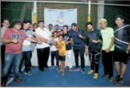
BOYS ELITE CUP WINNER - KARAGHOGHA ALL ROUNDERS