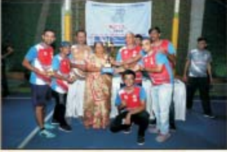
BOYS CHAMPION CUP WINNER KARAGHOGHA MIGHTIES

કારાઘોઘા બોક્સ ક્રિકેટ લીગ ૨૦૧૯ ને સફળ બનાવા સર્વે ગામવાસીઓનો ખુબ ખુબ આભાર